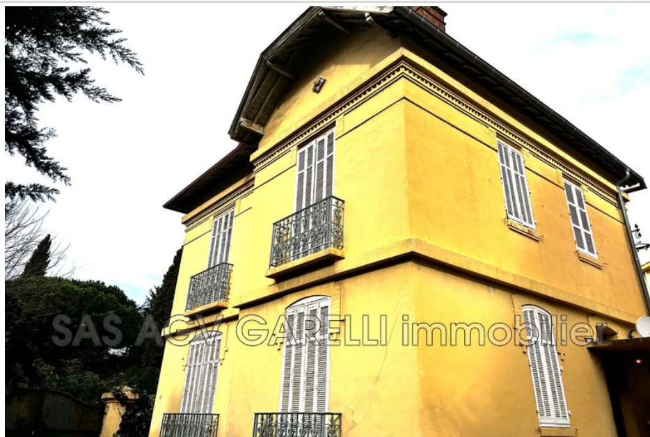
Maison réf. 744V2647M Hyères

AGV GARELLI IMMOBILIER vous propose à Hyères proche du centre-ville dans le quartier de la gare cette villa individuelle de 101.45 m 2 à rénover sur son terrain de 313 m 2 .